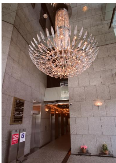
1階エレベーターロビー