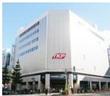
「TKP ガーデンシティ PREMIUM 札幌大通」外観

「TKP ガーデンシティ PREMIUM 札幌大通」は地下鉄大通駅地下直結の好立地にあり、全16室1,026席の貸会議室・ホール等を備えたカンファレンス施設です。5階は貸切とすることで、販売会等に最適な550㎡の大型物販会場としても使用可能です。同施設の地下2階～4階にはジュンク堂書店が出店しており、 会議や研修でTKP会場を利用するビジネス顧客と書店との相乗効果を活かし、地域経済の活性化に貢献してまいります。