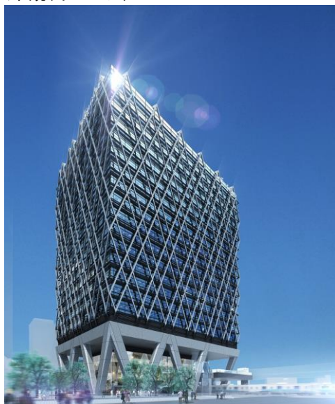
ビル外観(イメージ)