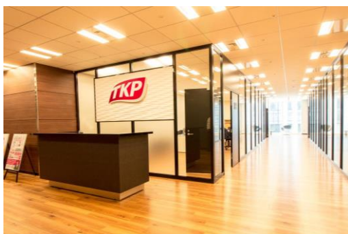
エントランス(イメージ)