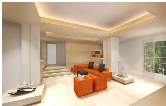
レクトーレ箱根強羅:イメージ(エントランス)