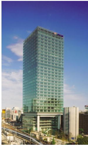
リージャス丸の内パシフィックセンチュリープレイス

同じエリアにオフィスを持つことは、その企業価値、生産性を大きく向上させることは間違いありません。それだけでなく、「リージャス丸の内パシフィックセンチュリープレイス」を中心に、集約型の大規模オフィスから、分散型のオフィス構築のシフトを図る契機をご提案できるのではないかと思います。本社オフィス含め分散化する場合、フレキシブルに対応できるシェアオフィスはまさに、リスク管理の大きなソリューションとなることは間違いありません。利便性と創造的なオフィススペースによって御社の働き方改革をも後押しできると確信しております。ご見学いただき、リージャスの価値を体験いただけますと幸いです。」と述べています。