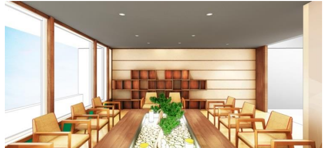
(ライブラリーラウンジ)