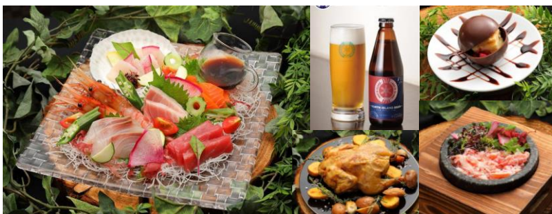
▲▲▲ （左）絆の旬鮮盛り合わせ （真中上）北海道地ビール「ノースアイランド」 （真ん中下）丸鶏のハーブロースト （右上）ショコラブリネット （右下）ズワイ蟹と根菜の釜飯

「Kizuna Susukino S4」自慢の料理をぜひ味覚と視覚でご堪能ください。