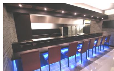
▲カウンター 8 席