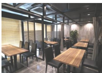
▲ラウンジ 40 席