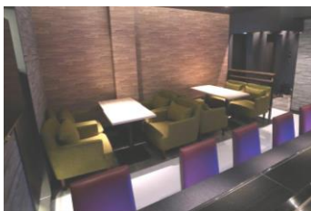
▲カウンターテーブル 8 席