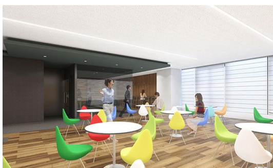
ラウンジ(イメージ)