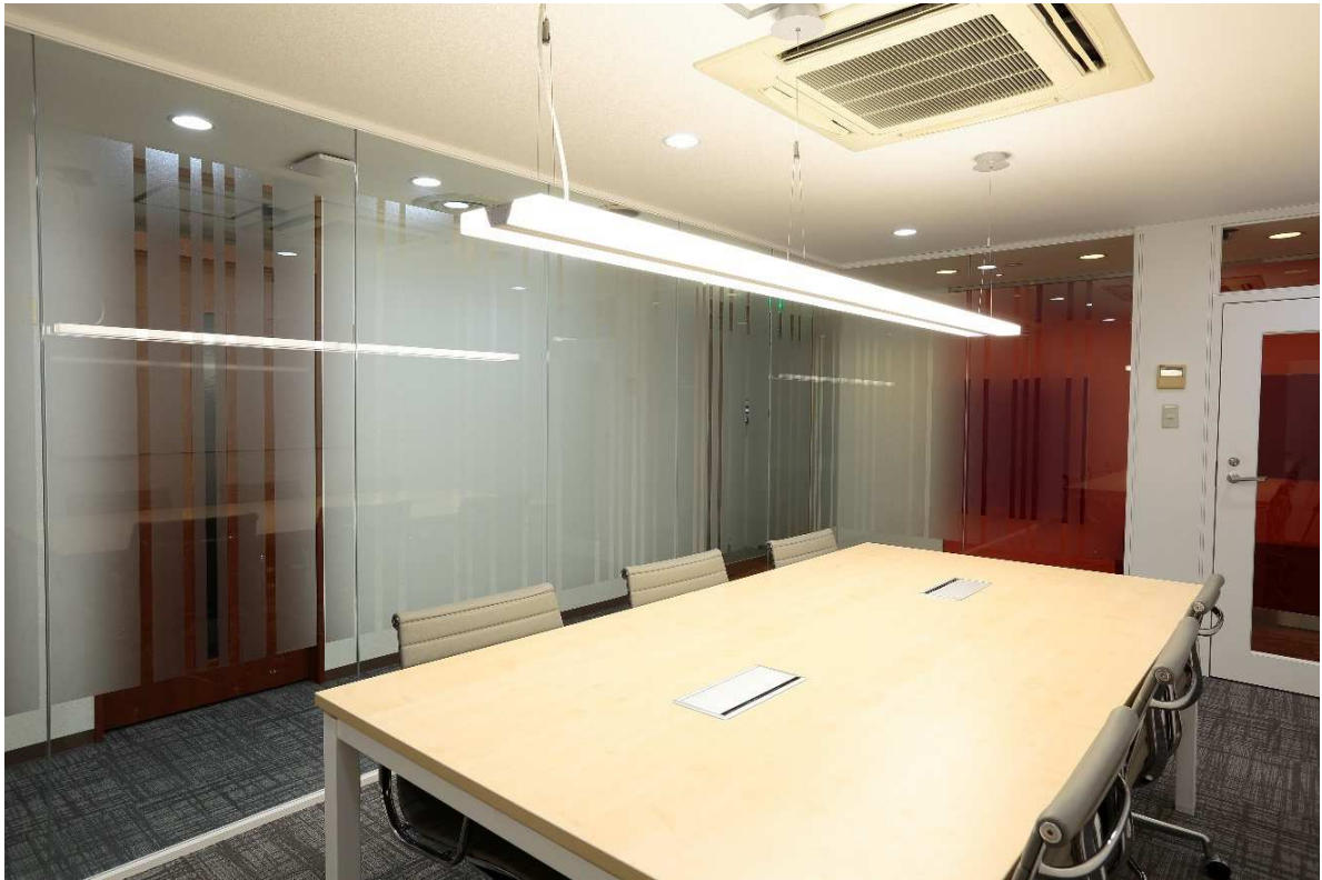
ミーティングスペース