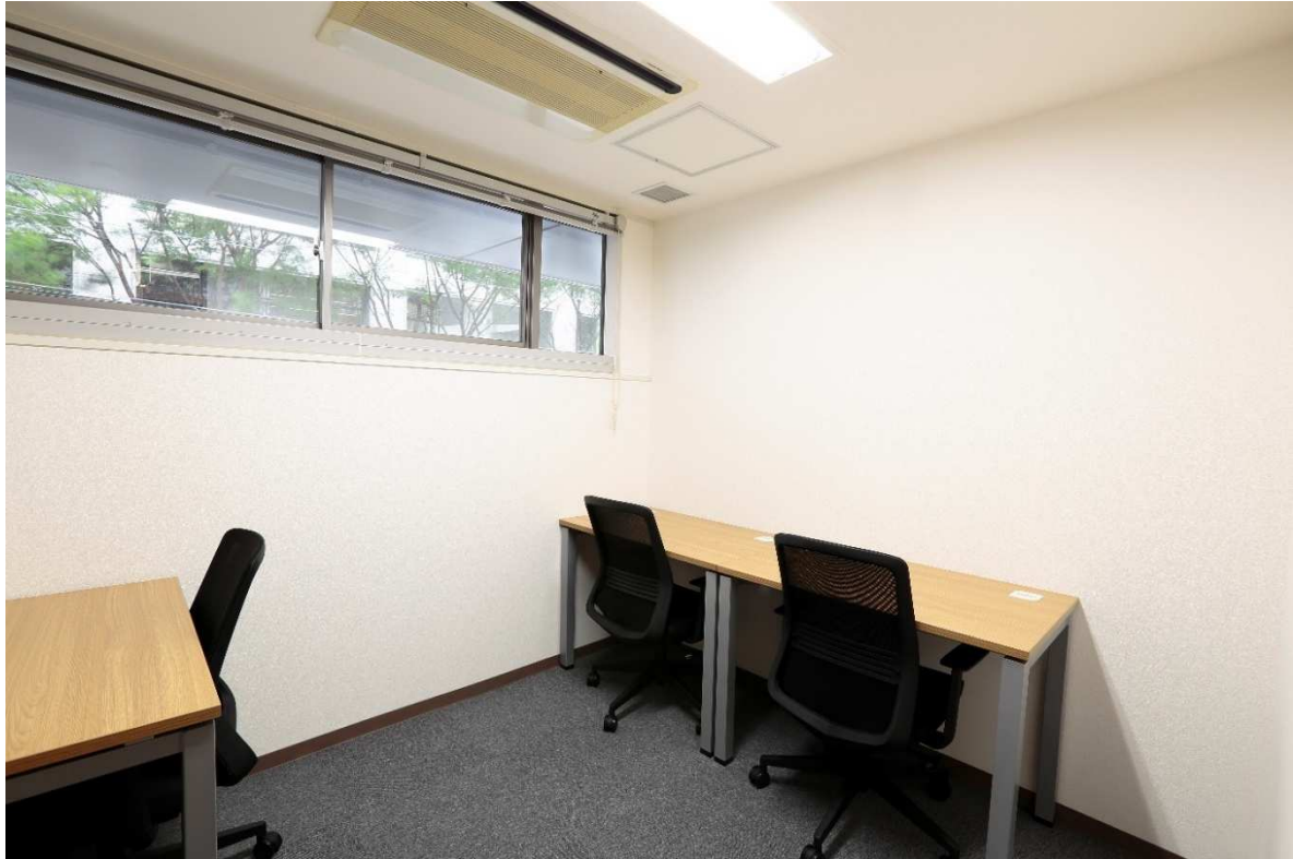
プライベートオフィス