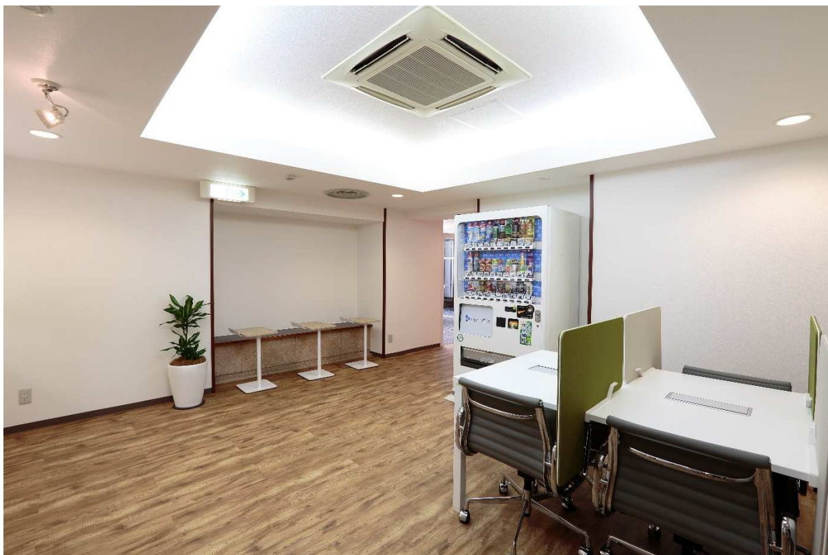
コワーキングエリア・休憩スペース

現在リージャスでは、大阪エリアで『リージャス』ブランドを12拠点、リーズナブルな『オープンオフィス』ブランドを4拠点、計16拠点のフレキシブルオフィスを展開しており、大阪エリアでは17拠点目となる施設です。『オープンオフィス』ブランドは無人運営のため、必要なオフィス家具や設備を備えながらもリーズナブルな料金でセキュアなワークスペースをご提供します。本社機能のオフィスや支店・営業所としてご利用可能なプライベートオフィスから、1名様向けのデスクを占有するコワーキングタイプまで多彩なプランをご用意しています。また、同じビルには「TKP大阪御堂筋カンファレンスセンター」が入居。収容人数が多いカンファレンスルームで、ソーシャルディスタンスを保ったイベントなどを柔軟に行うことが可能です。