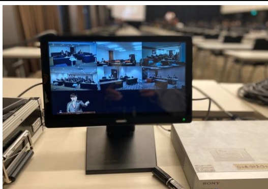
テレビ会議システム