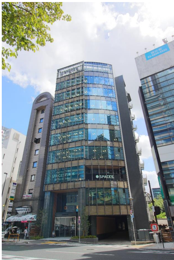
SPACES 六本木 ビル外観

https://www.regus-office.jp/spaces_roppongi/