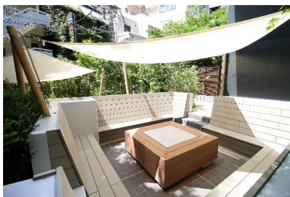
1階ガーデン（ミーティングスペース）