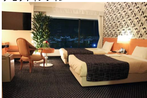
エグゼクティブツイン