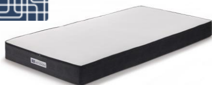
「ファーストキャビン TKP 市ヶ谷」向け 特別仕様マットレス