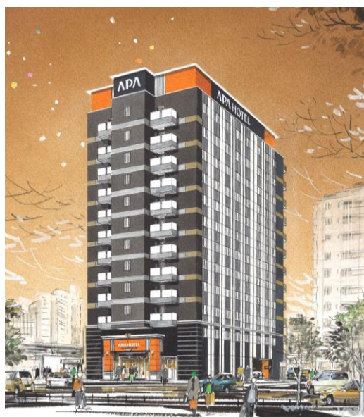
アパホテル〈博多東比恵駅前〉イメージパース